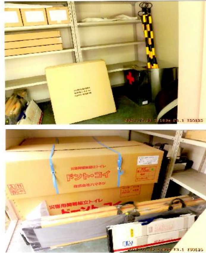
防災備蓄倉庫保管機材