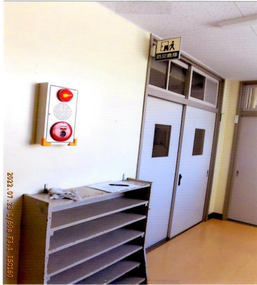
中校舎2階 防災倉庫