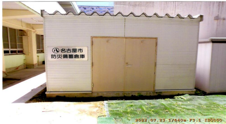
中庭1回防災備蓄倉庫