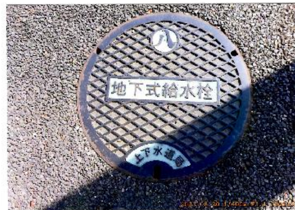
地下式給水栓(南門前東側)